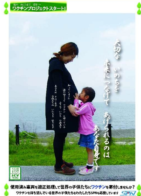
使用済み車両を適正処理して世界の子供達にワクチンを寄付しませんか？ ワクチンを待ち望んでいる世界の子供達をわたしもSPNも応援しています